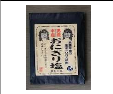
商品名 おにぎり塩 売価 242円 (税抜) 内容量 40g JANコード 4560172746305