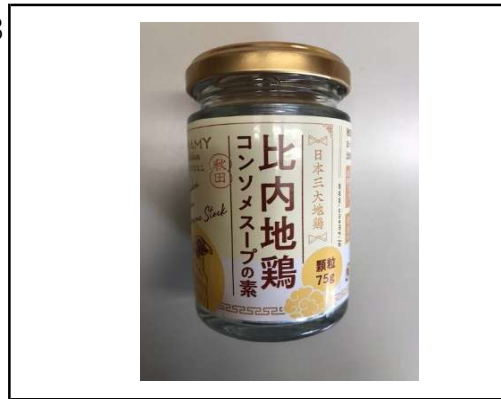
商品名 比内地鶏コンソメスープの素 売価 550円（税抜） 内容量 75g JANコード 4562418240783