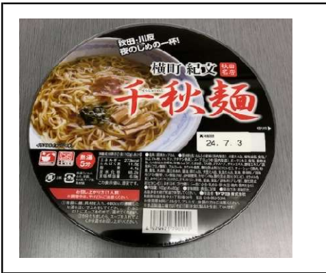
商品名 横町 紀文 千秋麺 (カップ) 売価 500円 (税抜) 内容量 1人前 JANコード 4979971790110