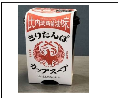
商品名 きりたんぽカップ 比内地鶏醤油味 売価 550円 (税抜) 内容量 106g JANコード 4582438051107