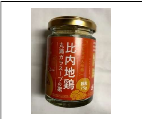
商品名 比内地鶏丸鶏ガラスープの素 売価 550円（税抜） 内容量 75g JANコード 4562418240554