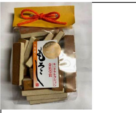
商品名 両面巾着もろこし 売価 350円 (税抜) 内容量 120g JANコード 4954023015014