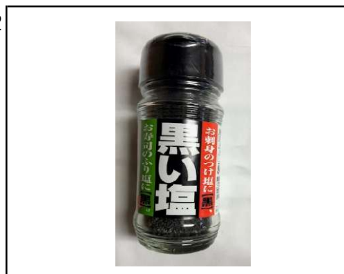
商品名 黒い塩 売価 550円 (税抜) 内容量 40g JANコード 4560172747005