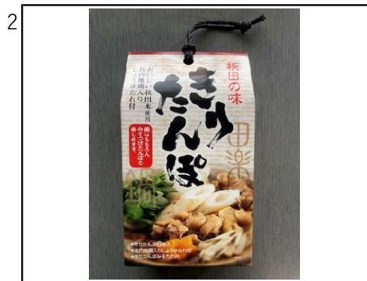
商品名 きりたんぽ6本入り 売価 1,120円 (税抜) 内容量 2~3人前 JANコード 4956877400046