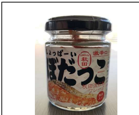
商品名 しょっぱーいぼだっこ 売価 800円(税抜) 内容量 30g JANコード 4562418240851