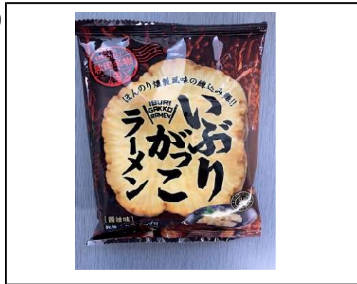
商品名 いぶりがっこラーメン 売価 330円 (税抜) 内容量 1人前 JANコード 4582438058892