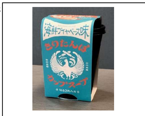
商品名 きりたんぽカップ海鮮ブイヤベース味 売価 550円 (税抜) 内容量 106g JANコード 4582438051114