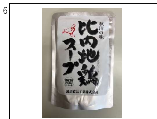
商品名 比内地鶏スープ 売価 280円 (税抜) 内容量 200g JANコード 4956877410069