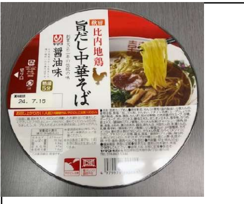
商品名 比内地鶏旨だし中華そば (カップ) 売価 500円 (税抜) 内容量 1人前 JANコード 4979971790011