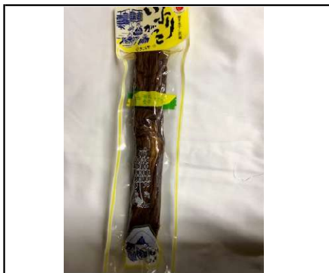
商品名 雄勝野きむらやいぶりがっこLサイズ 売価 759円 (税抜) 内容量 260g JANコード 4969930000039