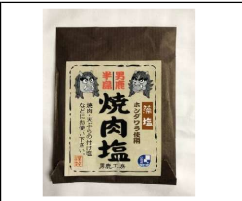
商品名 焼肉塩 売価 246円 (税抜) 内容量 40g JANコード 4560172746312