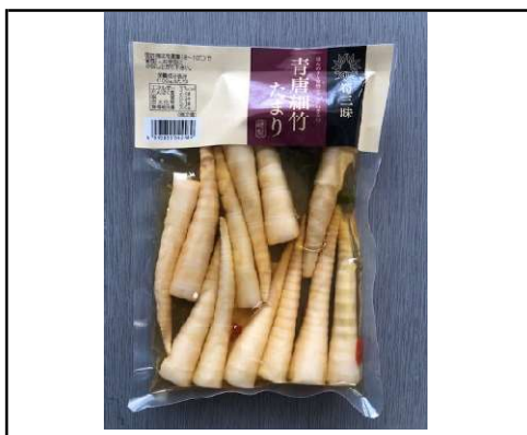
商品名 青唐細竹たまり 売価 600円（税抜） 内容量 230g JANコード 4990855042989