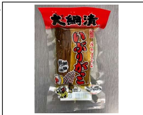
商品名 大網漬いぶり ミニ 売価 550円(税抜) 内容量150g JANコード 4906895000025