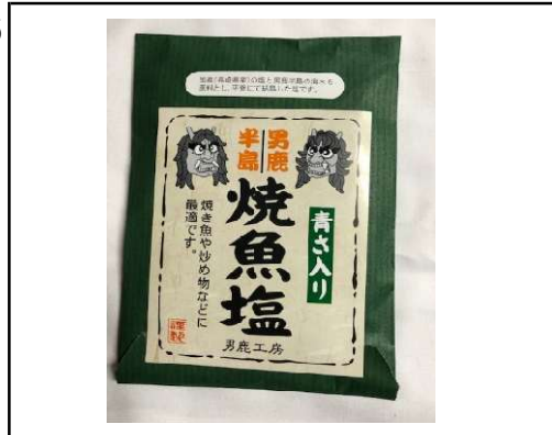
商品名 焼魚塩 売価 242円 (税抜) 内容量 40g JANコード 4560172746329