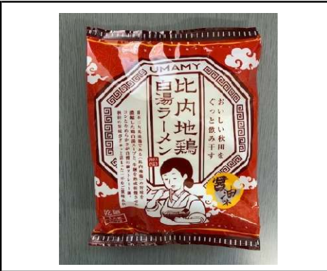
商品名 比内地鶏白湯ラーメン 醤油味 売価 300円 (税抜) 内容量 1人前 JANコード 4562418240103