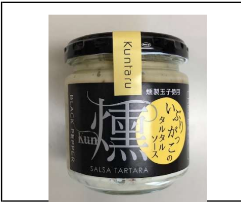
商品名 いぶりがっこタルタルブラックペッパー 売価 750円 (税抜) 内容量 150g JANコード 4969670025224