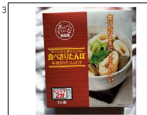
商品名 食べきりたんぽ 売価 720円 (税抜) 内容量 1人前 JANコード 4956877410014