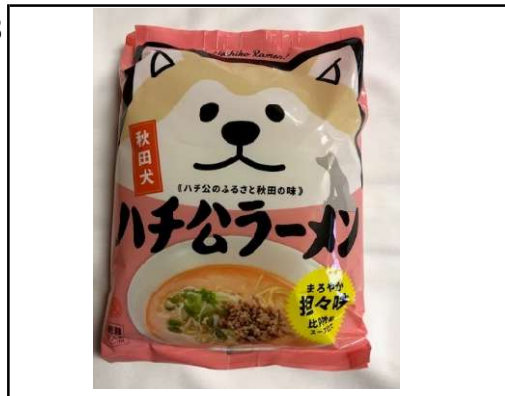
商品名 ハチ公ラーメン まろやか坦々味 売価 300円 (税抜) 内容量 1人前 JANコード 4582438058908