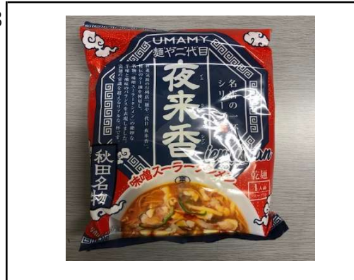
商品名 夜来香 味噌スーラータンメン 売価 350円（税抜） 内容量 1人前 JANコード 4562418240806