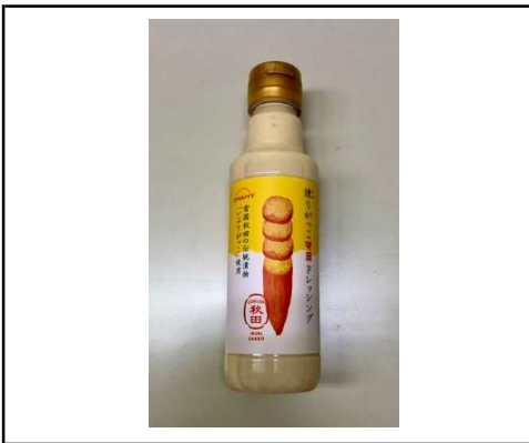
商品名 いぶりがっこマヨドレッシング 売価 550円 (税抜) 内容量 200g JANコード 4562418240868