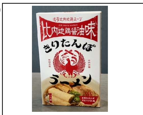
商品名 きりたんぽラーメン比内地鶏醤油味 売価 580円 (税抜) 内容量 190g JANコード 4582438058786