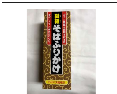
商品名 韃靼そばふりかけ 売価 550円 (税抜) 内容量 90g JANコード 4964888430204