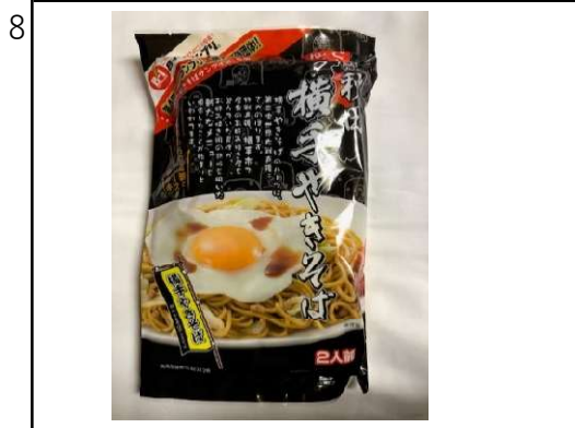
商品名 横手焼きそば (袋) 売価 600円 (税抜) 内容量 2人前 JANコード 4920539150204