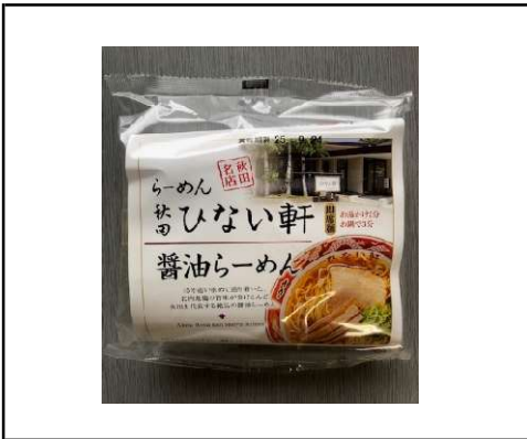
商品名 ひない軒醤油らーめん 売価 350円（税抜） 内容量 1人前 JANコード 4979971715007