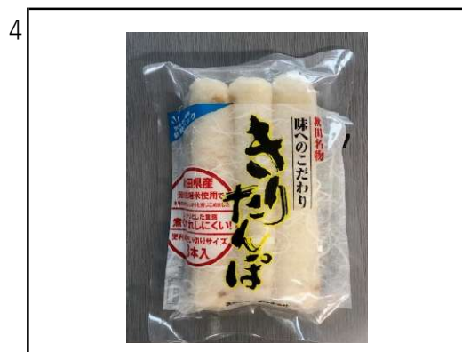
商品名 きりたんぽ3本入り (袋) 売価 530円 (税抜) 内容量 70g×3 JANコード 4956877970037