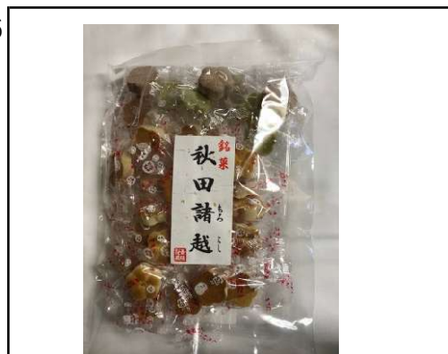
商品名 三色つつみもろこし 売価 350円 (税抜) 内容量 140g JANコード 4963216101199