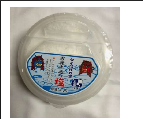
商品名 男鹿半島の塩 タッパー入 売価 383円 (税抜) 内容量 80g JANコード 4560172746046