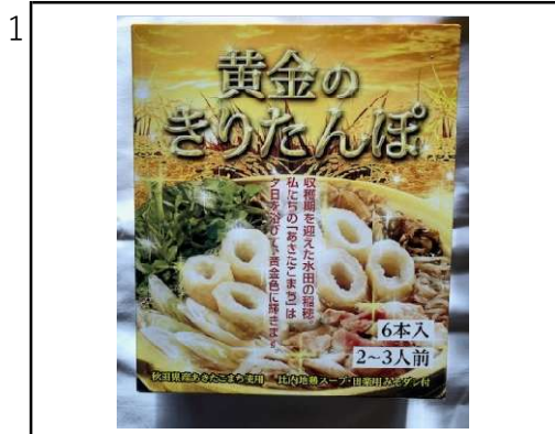
商品名 黄金のきりたんぽ6本入 売価 950円 (税別) 内容量 2~3人前 JANコード 4956877410014