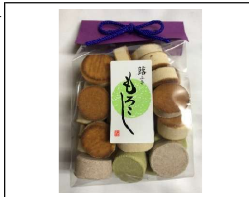
商品名 落巾着もろこし 売価 350円 (税抜) 内容量 120g JANコード 4954023015311