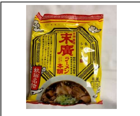
商品名 名店の一杯 末廣ラーメン 売価 350円（税抜） 内容量 1人前 JANコード 4562418240448