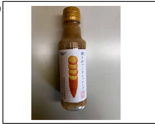
商品名 燻りがっこドレッシング 売価 550円 (税抜) 内容量 200g JANコード 4562418240776