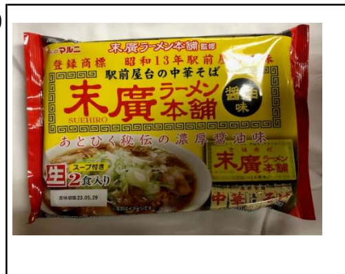
商品名 末廣ラーメン 売価 570円（税抜） 内容量 2食入 JANコード 4963978122074