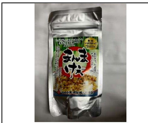
商品名 まんまけえ 売価 463円 (税抜) 内容量 100g JANコード 4580199980247