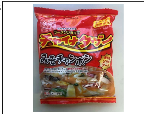
商品名 チャイナタウン味噌チャンポン 売価 350円（税抜） 内容量 1人前 JANコード 4979971715014