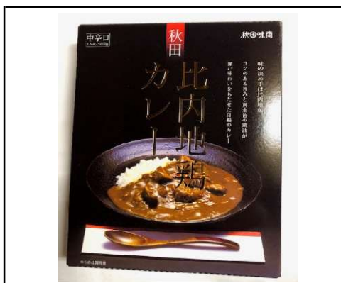
商品名 比内地鶏カレー 売価 700円 (税抜) 内容量 1人前 JANコード 4997683010272