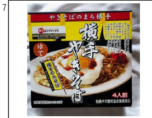
商品名 横手や焼きそば (箱) 売価 1,200円 (税抜) 内容量 4人前 JANコード 4920539150402