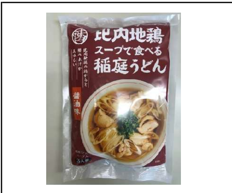
商品名 比内地鶏スープで食べる稲庭うどん 醤油味 売価 1,180円 (税抜) 内容量 3人前 JANコード 4997683060321