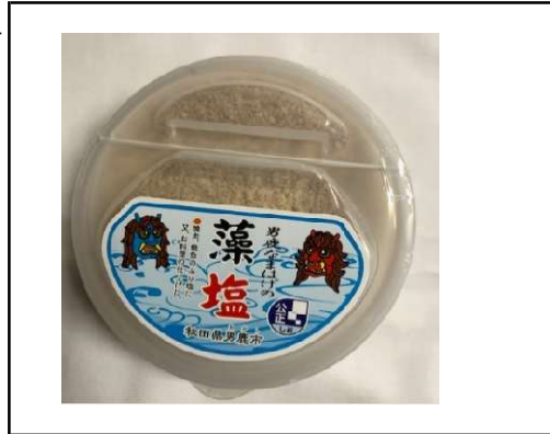
商品名 男鹿半島の藻塩 タッパー入 売価 513円 (税抜) 内容量 80g JANコード 4560172746053