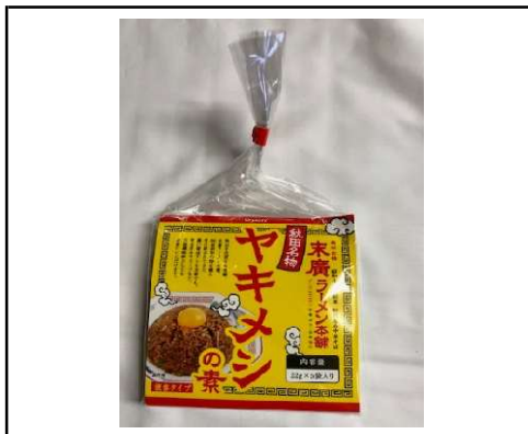
商品名 末廣ヤキメシの素 売価 460円(税抜) 内容量 22g×5 JANコード 4562418240455