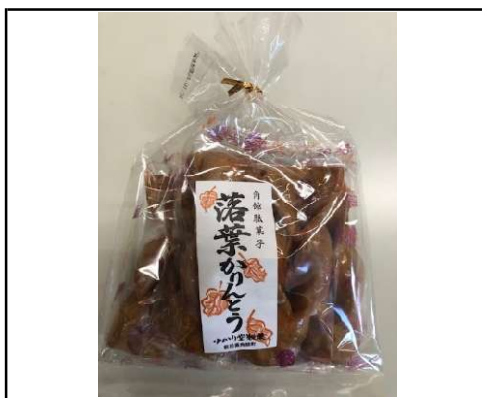
商品名 落葉かりんとう巾着 売価 300円 (税抜) 内容量 5本 JANコード 4955623003319