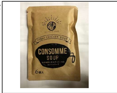
商品名 比内地鶏と玉ねぎ・ポークコンソメスープ 売価 380円 (税抜) 内容量 14g×6 JANコード 4997683050414