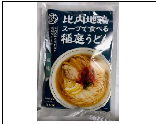
商品名 比内地鶏スープで食べる稲庭うどん 塩味 売価 1,180円 (税抜) 内容量 3人前 JANコード 4997683060314