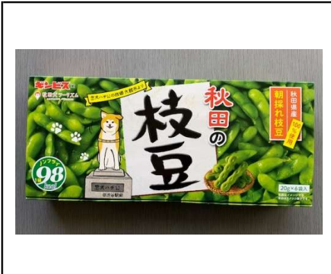
商品名 秋田の枝豆 売価 800円（税抜） 内容量20g×6 JANコード 4589451950097