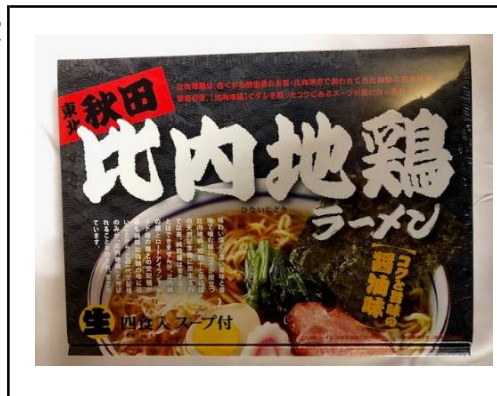
商品名 比内地鶏ラーメン 売価 1000円(税抜) 内容量 4食入り JANコード 4972874605574