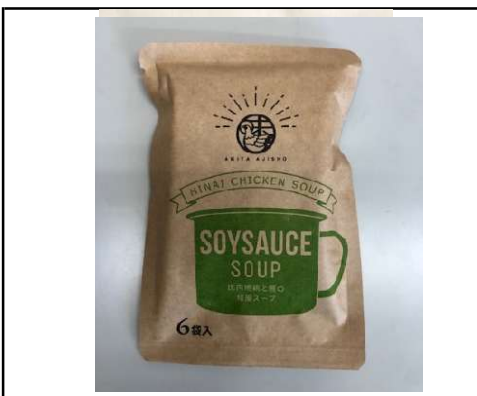
商品名 比内地鶏と鰹の和風スープ 売価 380円 (税抜) 内容量 14g×6 JANコード 4997683050407