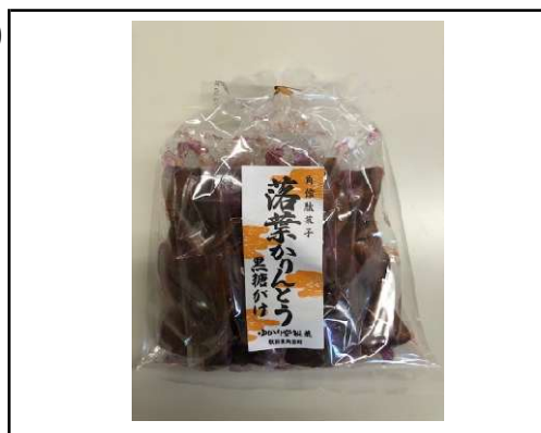
商品名 落葉かりんとう巾着黒糖かけ 売価 300円 (税抜) 内容量 5本 JANコード 4955623003326