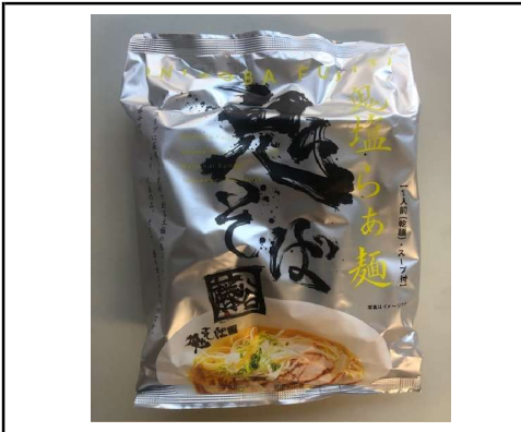
商品名 藤谷 鬼塩らあめん 売価 380円（税抜） 内容量 1人前 JANコード 4562418240912