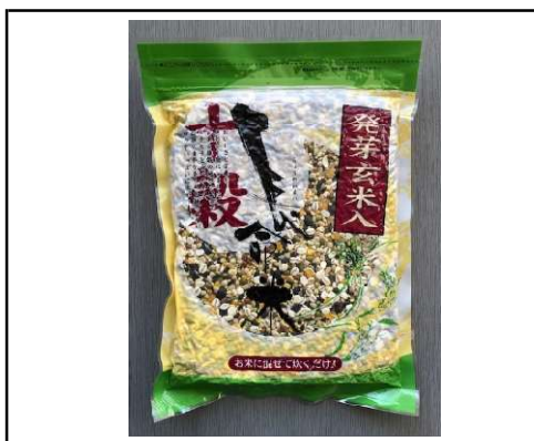
商品名 長命米 売価 500円 (税抜) 内容量 400g JANコード 4990855063120