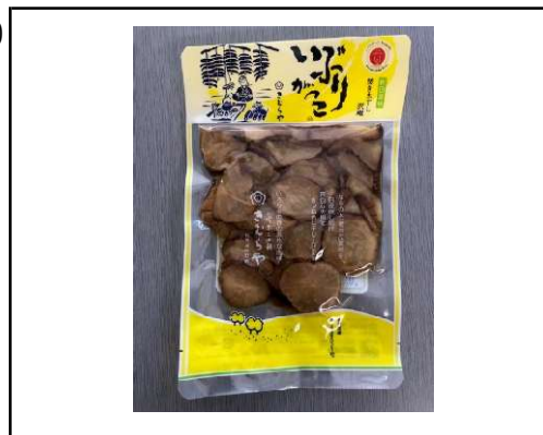
商品名 雄勝野きむらやいぶりがっこスライス 売価 541円 (税抜) 内容量 150g JANコード 4969930000664