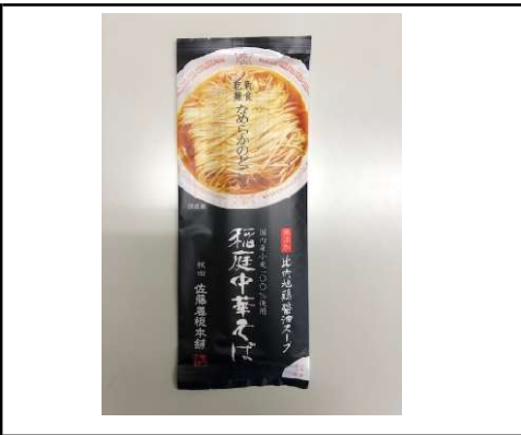
商品名 稲庭中華そば 醤油味 売価 700円 (税抜) 内容量 2人前 JANコード 4992099000183