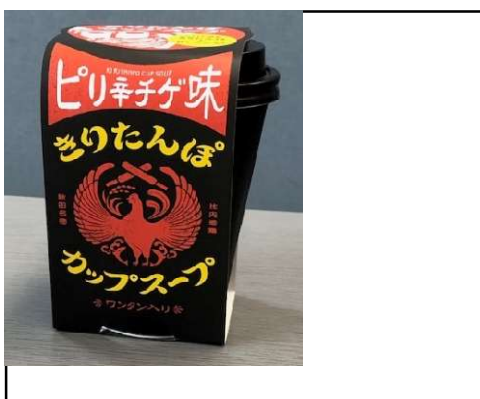
商品名 きりたんぽカップ ピリ辛チゲ味 売価 550円 (税抜) 内容量 106g JANコード 4582438051169