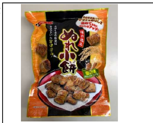
商品名 ぬれ小餅 売価 350円 (税抜) 内容量 140g JANコード 4970311200085