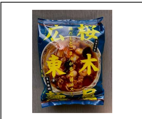
商品名 桜木屋 広東麺 売価 350円 (税抜) 内容量 1人前 JANコード 4582438058984