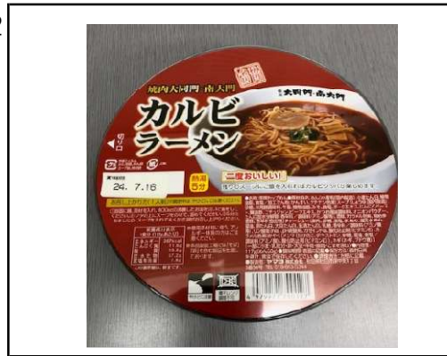
商品名 焼肉大同門・南大門カルピラーメン (カップ) 売価 500円 (税抜) 内容量 1人前 JANコード 4979971790127