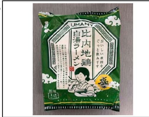
商品名 比内地鶏白湯ラーメン 塩味 売価 300円 (税抜) 内容量 1人前 JANコード 4562418240110