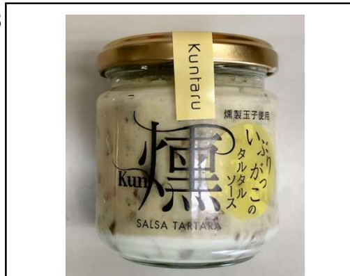
商品名 いぶりがっこタルタルソース 売価 750円 (税抜) 内容量 160g JANコード 4969670025125