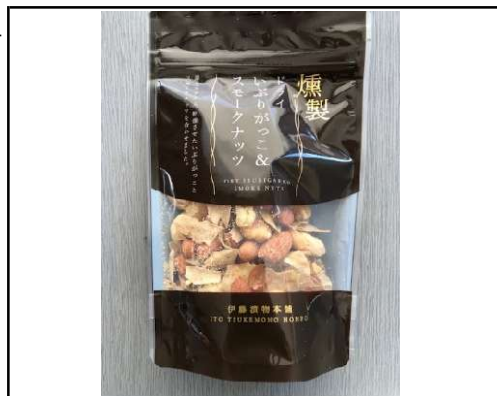
商品名 ドライいぶりがっこ&スモークナッツ 売価 500円(税抜) 内容量 55g JANコード 4969670131703