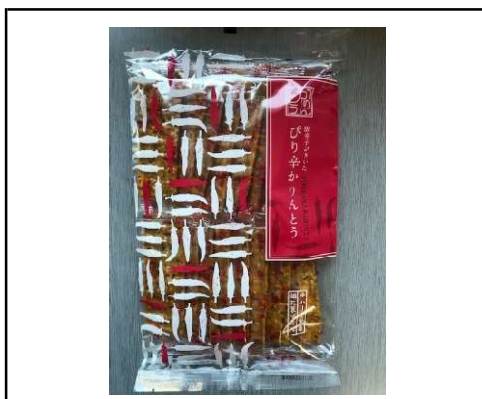
商品名 ぴり辛かりんとう 売価 420円 (税抜) 内容量 16枚 JANコード 4955623001285