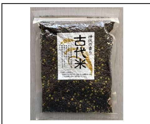
商品名 古代米 売価 500円 (税抜) 内容量 300g JANコード 4990855080622