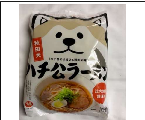
商品名 ハチ公ラーメン 比内地鶏醤油味 売価 300円 (税抜) 内容量 1人前 JANコード 4582438058885