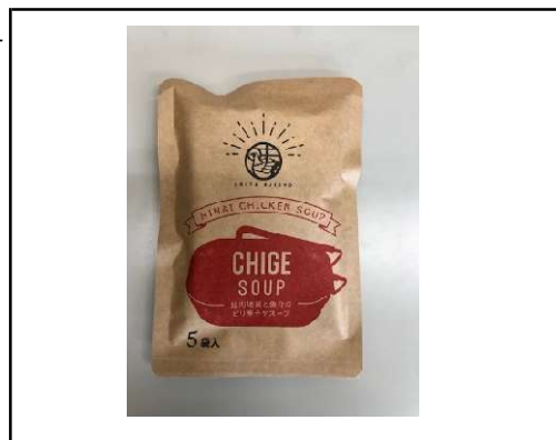
商品名 比内地鶏と魚介のピリ辛チゲスープ 売価 380円 (税抜) 内容量 90g JANコード 4997683050391