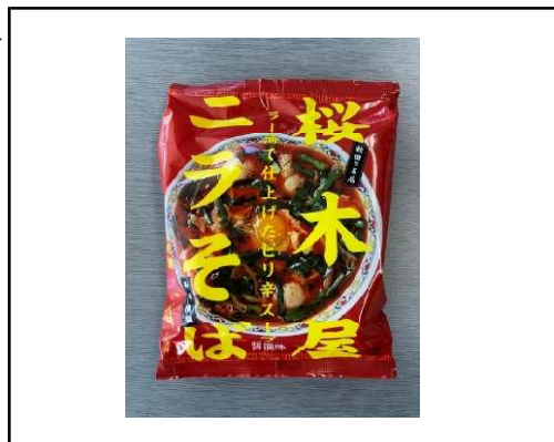
商品名 桜木屋ニラそば 売価 350円 (税抜) 内容量 1人前 JANコード 4582438058977