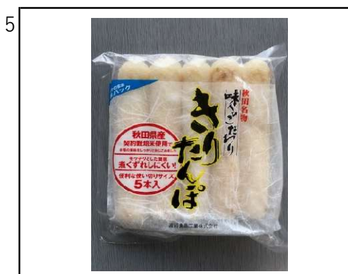
商品名 きりたんぽ5本入り (袋) 売価 870円 (税抜) 内容量 70g×5 JANコード 4956877980036