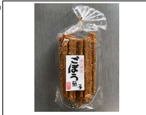
商品名 きんぴらごぼう菓子 売価 350円（税抜） 内容量15本 JANコード 4975275602500