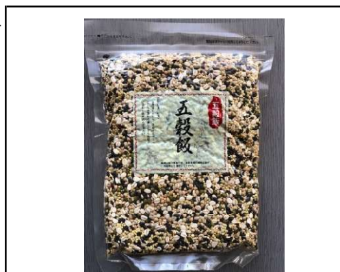
商品名 五穀飯 売価 500円 (税抜) 内容量 400g JANコード 4990855090614