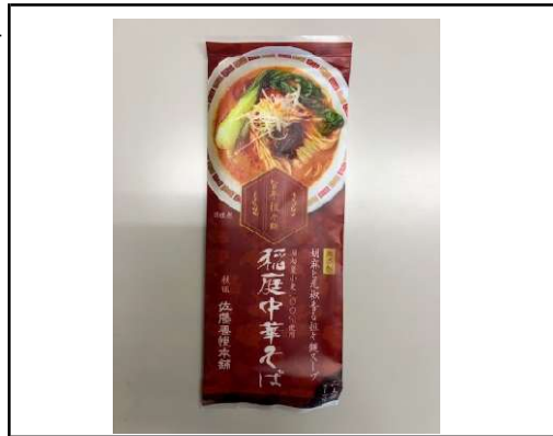
商品名 稲庭中華そば 坦々スープ 売価 800円 (税抜) 内容量 2人前 JANコード 4992099000961