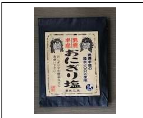
商品名 おにぎり塩 売価 220円（税抜） 内容量 40g JANコード 4560172746305