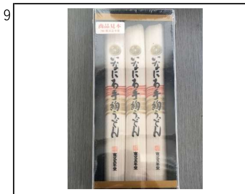
商品名 寛文五年堂稲庭手鞠饅頭 売価 1,000円 (税抜) 内容量80g×3 JANコード 4950034000032