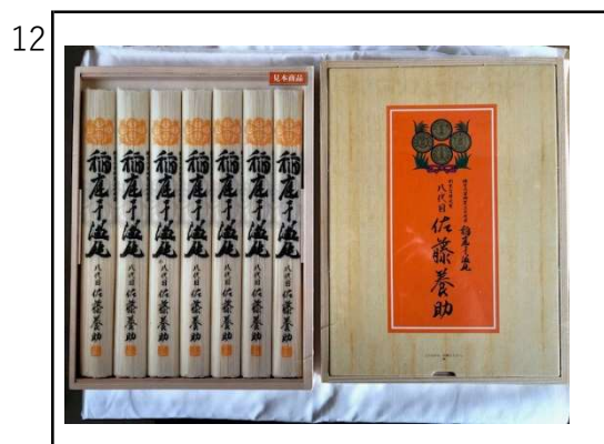
商品名 佐藤養助稲庭干饅頭MYS30N 売価 3,000円 (税抜) 内容量 80g×7 JANコード 4964206003189