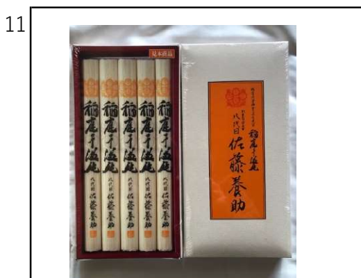
商品名 佐藤養助稲庭干饅頭MYS20N 売価 2,000円 (税抜) 内容量80g×5 JANコード 4964206002182