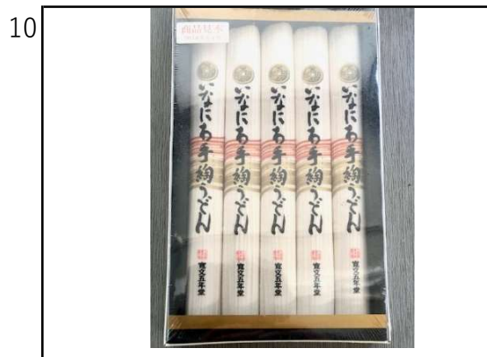
商品名 寛文五年堂稲庭手鞠饅頭 売価 1,500円 (税抜) 内容量80g×5 JANコード 4950034000056