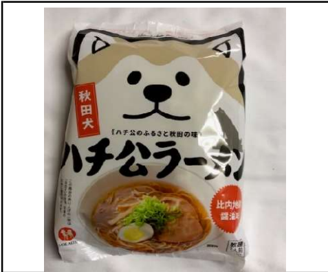
商品名 ハチ公ラーメン 比内地鶏醤油味 売価 300円 (税抜) 内容量 1人前 JANコード 4582438058885