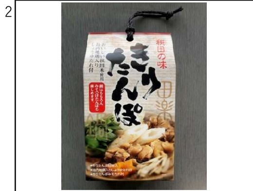
商品名 きりたんぽ6本入り 売価 880円 (税抜) 内容量 2~3人前 JANコード 4956877400046