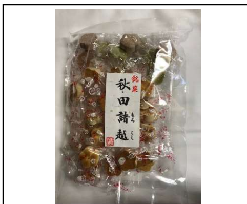
商品名 三色つつみもろこし 売価 300円 (税抜) 内容量 130g JANコード 4963216101199