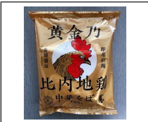
商品名 黄金乃比内地鶏中華そば 売価 300円 (税抜) 内容量 1人前 JANコード 4582438058878