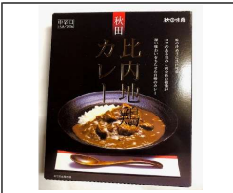
商品名 比内地鶏カレー 売価 600円(税抜) 内容量 1人前 JANコード 4997683010272