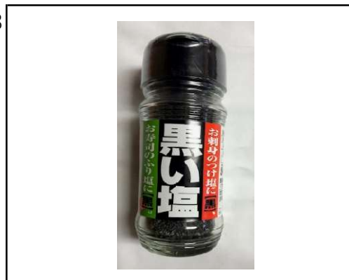
商品名 黒い塩 売価 500円（税抜） 内容量 40g JANコード 4560172747005