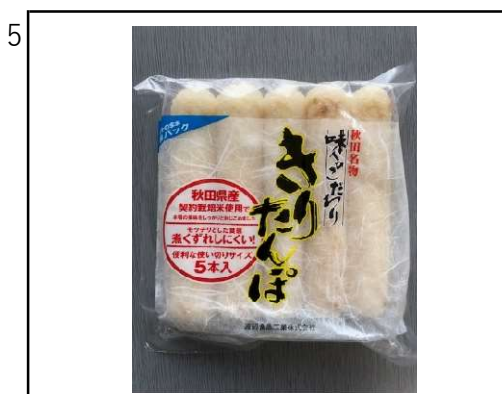
商品名 きりたんぽ5本入り (袋) 売価 570円 (税抜) 内容量 70g×5 JANコード 4956877980036