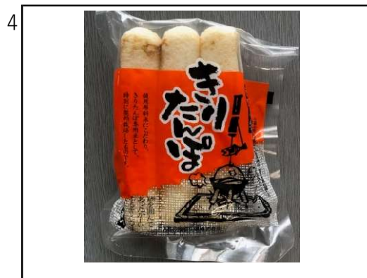
商品名 きりたんぽ3本入り (袋) 売価 360円 (税抜) 内容量 70g×3 JANコード 4956877960052