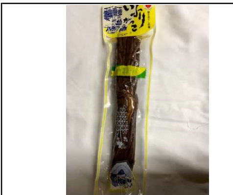
商品名 雄勝野きむらやいぶりがっこLサイズ 売価 759円 (税抜) 内容量 260g JANコード 4969930000039