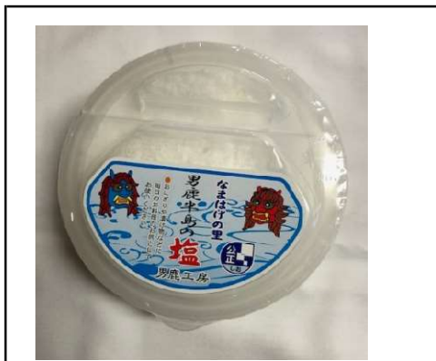
商品名 男鹿半島の塩 タッパー入 売価 330円（税抜） 内容量 80g JANコード 4560172746046