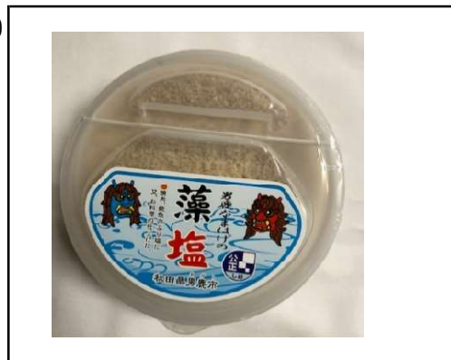
商品名 男鹿半島の藻塩 タッパー入 売価 440円（税抜） 内容量 80g JANコード 4560172746053