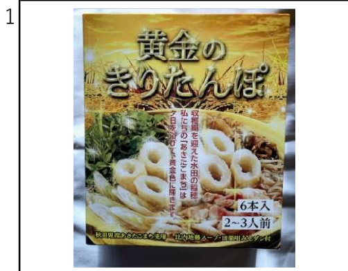
商品名 黄金のきりたんぽ6本入 売価 700円 (税別) 内容量 2~3人前 JANコード 4956877410014