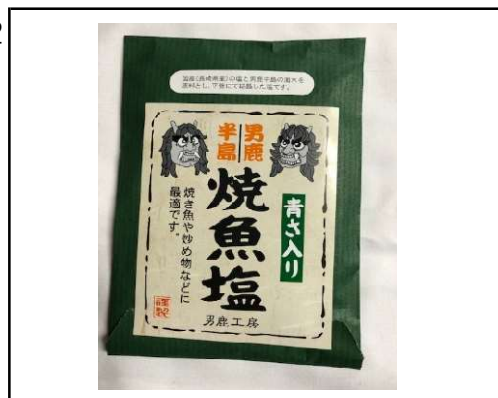
商品名 焼魚塩 売価 220円（税抜） 内容量 40g JANコード 4560172746329