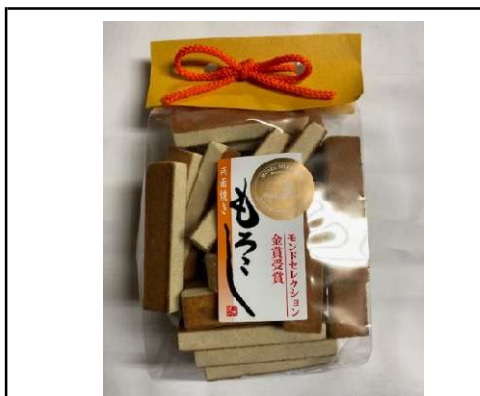
商品名 両面巾着もろこし 売価 350円（税抜） 内容量 120g JANコード 4954023015014