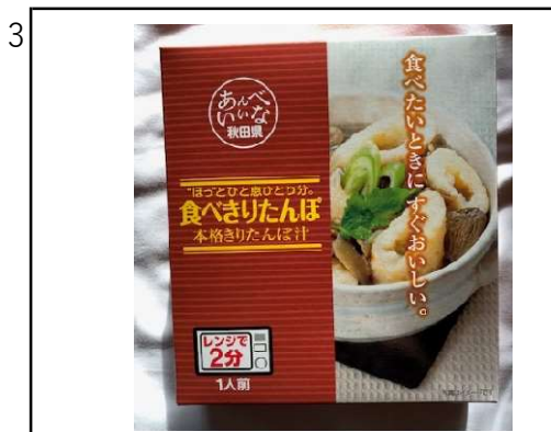
商品名 食べきりたんぽ 売価 600円 (税抜) 内容量 1人前 JANコード 4956877410014