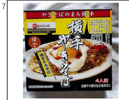
商品名 横手や焼きそば (箱) 売価 1,100円 (税抜) 内容量 4人前 JANコード 4920539150402