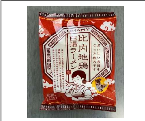
商品名 比内地鶏白湯ラーメン 醤油味 売価 300円 (税抜) 内容量 1人前 JANコード 4562418240103