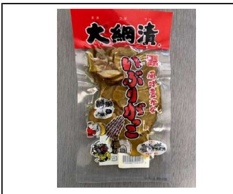
商品名 大綱漬いぶり スライス 売価 530円(税抜) 内容量150g JANコード 4906895000223