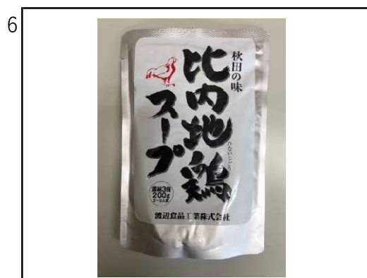
商品名 比内地鶏スープ 売価 280円 (税抜) 内容量 200g JANコード 4956877410069