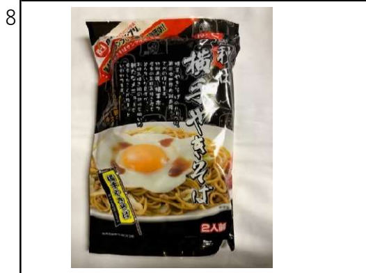
商品名 横手焼きそば (袋) 売価 550円 (税抜) 内容量 2人前 JANコード 4920539150204