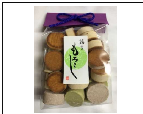
商品名 落巾着もろこし 売価 350円（税抜） 内容量 120g JANコード 4954023015311