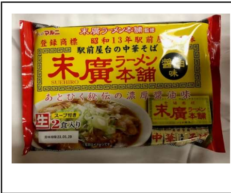
商品名 末廣ラーメン 売価 570円 (税抜) 内容量 2食入 JANコード 4963978122074