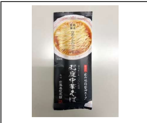
商品名 稲庭中華そば 醤油味 売価 600円 (税抜) 内容量 2人前 JANコード 4992099000183